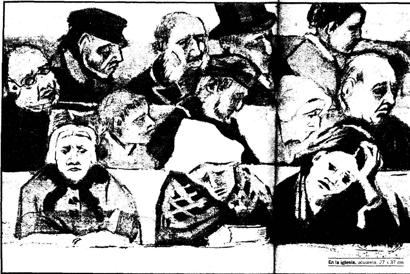
En la iglesia, acuarela, 27 x 37 cm

Los procesos propiamente psicoanalíticos y psicosociológicos de la cuestión de la identificación ya han sido, sino agotados -¿cómo podrían serlo?- ampliamente abordados por los expositores que me han precedido. Así que me situaré desde otro punto de vista, el punto de vista social-histórico, que no significa sociológico en el sentido habitual.