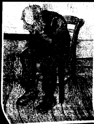
Portada: A las puertas de la eternidad Oscar Friesneda. 84 x 62 cm

298 Reseña de libros ■ Psiquis y sociedad Una crítica al racionalismo ■ Freud: una vida de nuestro tiempo ■ De los derechos, las garantías y los deberes ■ La identidad ■ Municipios y regiones de Colombia