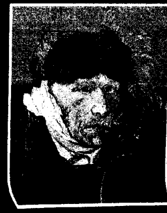
Contraportada: Autorretrato. El mundo de hoy. Oscar Friesneda. 84 x 62 cm

SUSCRIPCIONES Y COMUNICACIONES Calle 54 N° 4-42 oficina 101. Tel/fax: (57-1) 3126296; 2139937; 3107250 Santa Fe de Bogotá, Colombia. Apartado Aéreo 36305. E-mail: fagio@usa.net