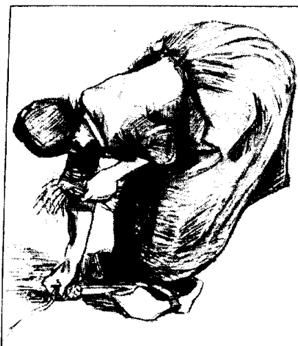
Gavilladora Lapiz negro, 52 x 43 cm

de una identificación final de cada individuo, que es siempre también una identificación a un «nosotros», «nosotros otros», a una colectividad en derecho imperecedera; lo que, sea religión o no religión, tiene aún una función fundamental, ya que es una defensa y sin duda la principal defensa del individuo social contra la Muerte, lo inaceptable de su mortalidad. Pero la colectividad sólo es, idealmente, eterna,