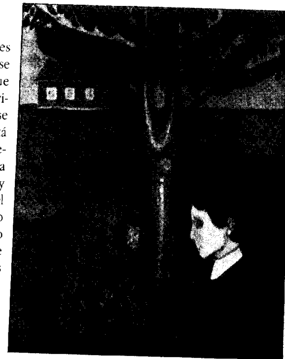
Mirándose a los ojos Óleo sobre tela, 1894 136 x 110 cm

Lo que nos importa es el conocimiento efectivo de los sujetos efectivos, no un fantasma trascendental ni una idealidad inaccesible. Paradoja solamente aparente, la preocupación exclusiva con