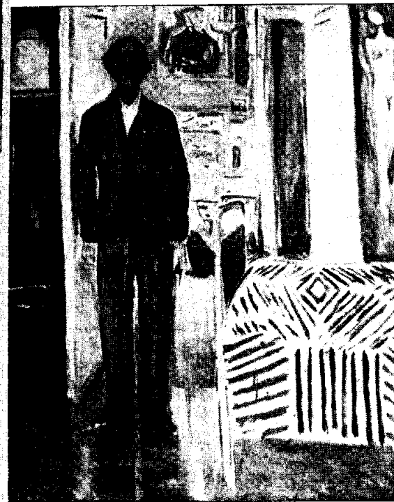
Autorretrato entre el reloj y la cama Oleo sobre tela, 1940-1942 149.5 x 120 cm

En uno de los extremos se sitúa la tesis "biologista" que, llevada al límite, conduciría a borrar esta