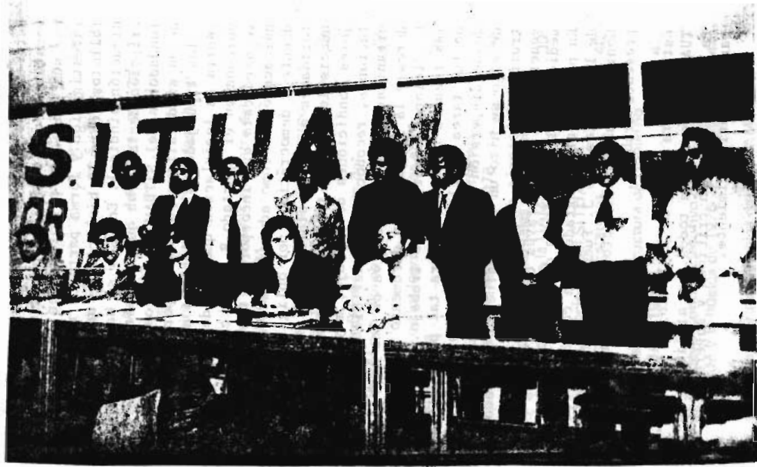
Asamblea Constitutiva del S.I.T.U.A.M.